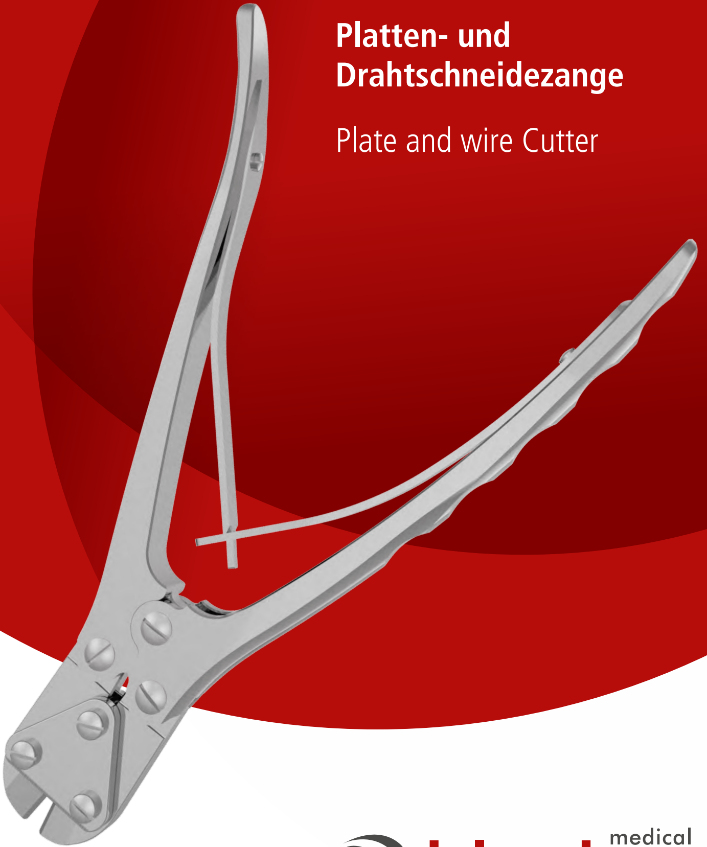
Plate and wire Cutter